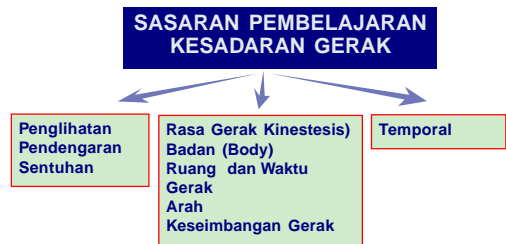
Gambar 1. Kesadaran gerak sebagai sasaran pembelajaran pendidikan jasmani (sumber : Gabbar, Physical Education For Children, 1987:17).

Belajar adalah suatu proses perubahan tingkah laku yang potensial terhadap situasi tertentu yang diperoleh dari pengalaman yang dilakukan secara berulang-ulang. Hilgard, (1981). Menurut Singer (1980), belajar adalah perubahan-perubahan perilaku yang potensial yang tercermin sebagai akibat dari latihan dan pengalaman masa lalu ter-