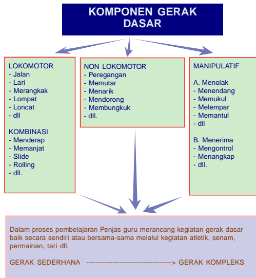
Gambar 2. Komponen dasar

Dari ketiga kesadaran gerak dasar tersebut yang harus dicapai melalui pendidikan jasmani di sekolah, maka komponen gerak dasar yang perlu diajarkan oleh guru dapat dikelompokkan sebagai berikut: